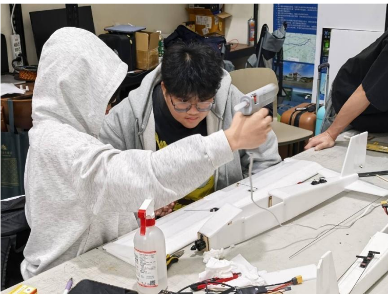
自己親手製作的定翼無人機。