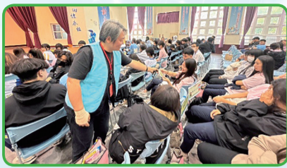
講師與學生有獎徵答互動