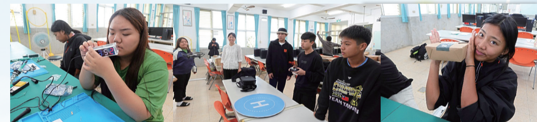
12/24(三)資電一乙適性試探實作體驗營1-電路焊接 試探與實作體驗營2-飛行機器人操作飛行