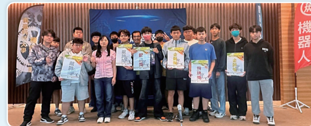
全體得獎16位同學賽後合影