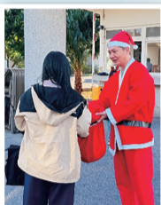
校長溫馨發放糖果及教室布置一隅

學務處於聖誕節前夕辦理系列活動，校長、家長會長與觀光科禮賓生於校門口發放糖果，傳遞溫暖祝福；各班同步進行聖誕暨新年教室布置，營造歡樂節慶氛圍，促進師生情感交流，為新年揭開溫馨序幕。